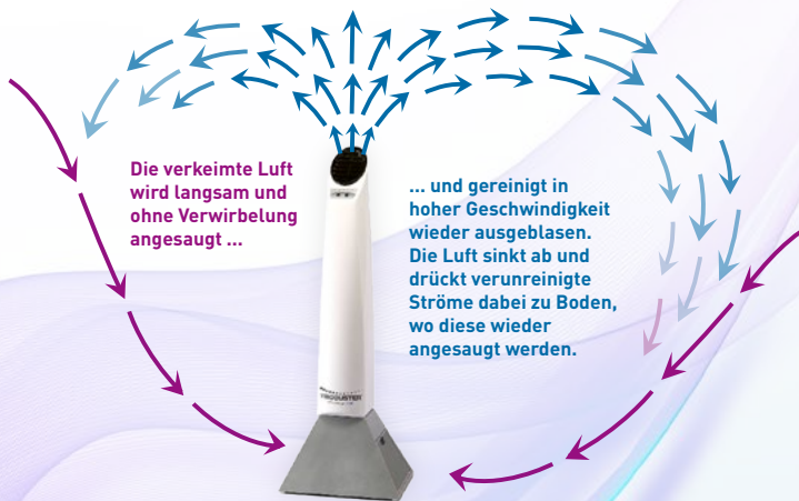
Schematische Darstellung des Downflow-Prinzips

Bei der Bestrahlung von Corona-Viren erzeugt die spezielle Bauform der VIROBUSTER®-Geräte außerdem eine gezielte Zirkulation nach dem Downflow-Prinzip . Dies verbessert die Luftqualität und minimiert Infektionsrisiken zusätzlich: